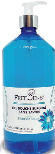
Fleur de Lotus