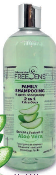
Aloé Véra BIO

Ce shampooing lave les cheveux en douceur. De PH neutre, il permet un nettoyage efficace tout en respectant le film hydrolipidique naturel du cuir chevelu. Sa formule testée sous contrôle dermatologique, est enrichie en extrait d' Aloé Véra . Elle contient également un agent gainant d'origine végétale extrait de L'Amande douce, afin de faciliter le démêlage. Délicieusement parfumé fleur de pommier et concentré en agents démêlants, ce shampooing au format généreux est idéal pour l'entretien de tous types de cheveux.