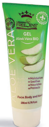
Aloé Véra BIO

0% Colorant, Graisses animales, Paraben, Sulfate, Phtalate, Savon