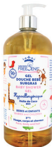
Huile de Coco BIO