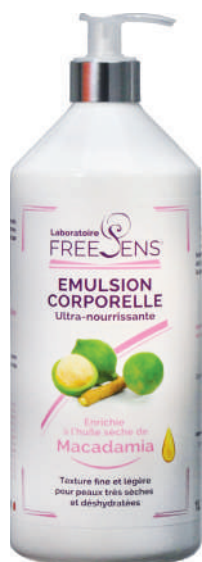
Huile Sèche de Macadamia