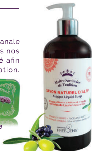
Huile d'Olive et Huile de baies de Laurier

Ce soin pour la peau, fabriqué suivant la formule originale utilisée à Alep, est composé de 80% d'huile d'Olive et 20% d'huile de baies de Laurier naturelles . C'est un savon-soin : l'huile d'Olive et l'huile de baies de Laurier ont toutes les 2 des propriétés hydratantes et apaisantes pour la peau, et également antiseptiques. Il peut être utilisé pour les peaux sèches et très sèches, pour les peaux les plus délicates et même sur le visage. Il est aussi conseillé pour les peaux présentant de l' eczéma , du psoriasis , de l' acné , des dermatoses , mais également, du fait de ses propriétés antiseptiques en cas de lésions : coupures, griffures, piqûres..