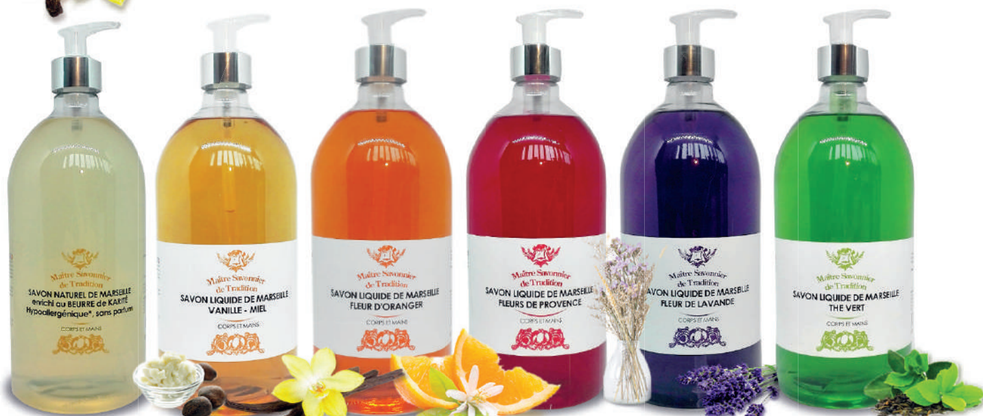
Naturel au Karité

Fabriqué par un Maître Savonnier de Tradition à partir d'huile 100% végétale, selon la méthode traditionnelle de saponification au chaudron, ce savon apporte confort et douceur par sa teneur en glycérine naturelle hydratante et ses qualités anti-desséchantes.