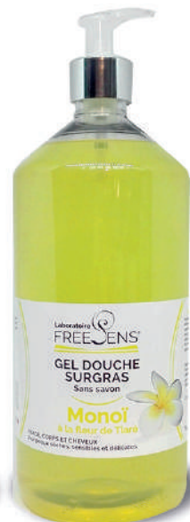
Fleur de Monoï