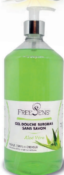
Aloé Vera BIO