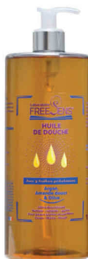
Argan, Olive et Amande douce

L'Huile de Douche FREESENS est enrichie aux 3 huiles précieuses : Huile d'Argan, Huile d'Amande Douce et Huile d'Olive . Elle nettoie et nourrit la peau en douceur et convient parfaitement aux peaux sèches, sensibles et délicates.