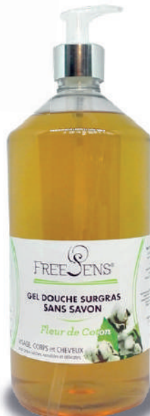
Fleur de Coton